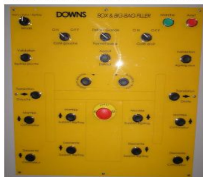
Interface machine conviviale: